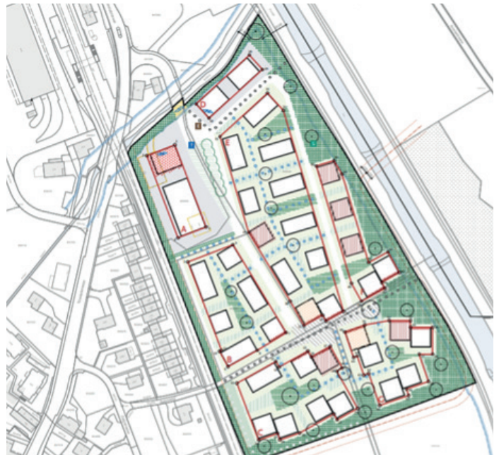
Abbildung 2: Situationsplan